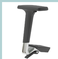
In drei Richtungen verstellbare 3D Armlehnen