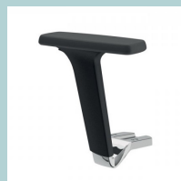
2D (in 2 Richtungen) verstellbare Armlehnen