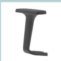
Fix montierte Armlehnen