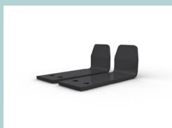
Verbindungsstücke (2 Stk.)